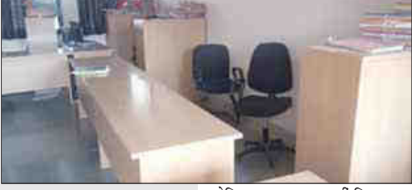
लेकिन उस पर अमल नहीं किया जा रहा है. इस कार्यालय में एक कृषि अधिकारी, 2 निर्माण शाखा अभियंता, 1 सहायक प्रशासन अधिकारी, 1 सहायक लेखाधिकारी, 1 कनिष्ठ लेखाधिकारी, 2 प्रशासन अधिकारी, 8 स्वास्थ्य व कृषि अधिकारी, 2 स्थापत्य अभियंत्रिकी सहायक, 5 वरिष्ठ सहायक, 12 कनिष्ठ सहायक, 1 वरिष्ठ लेखा सहायक, 1 कनिष्ठ लेखा सहायक, 1 वाहन चालक, 1 स्वास्थ्य सेवक, 4 परिचारक, 1 पशु पर्यवेक्षक इस तरह 45 कर्मचारी कार्यरत हैं. इनमें से एक जप में तथा 1 आयुक्त कार्यालय में सेवा दे रहा है. ऐसी लिखित जानकारी प्राप्त हुई, तो 15 कर्मचारी अनुपस्थित पाए गए. अनुपस्थित कर्मचारियों में निर्माण

संवाददाता/प्रतिदिन अखबार चांदूर बाजार, 24 नवंबर - स्थानीय पंचायत समिति प्रशासन पर किसी वरिष्ठ अधिकारी का नियंत्रण न रहने से सर्वत्र मनमानी कामकाज चल रहा है. शुक्रवार की सुबह 10.20 बजे प्रतिनिधि ने कार्यालय में पहुंचकर देखा तो गुट विकास अधिकारी छोड़कर अन्य विभागों में अधिकांश अधिकारी व कर्मचारी उपस्थित नहीं थे. पंचायत समिति कार्यालय के विविध विभागों में 45 कर्मचारी कार्यरत हैं. इनमें से 15 अधिकारी-कर्मचारी अनुपस्थित पाए गए. तो अन्य अधिकारी दौरे के नाम पर कार्यालय से गायब रहने की जानकारी मिली. स्थानीय निर्माण विभाग में