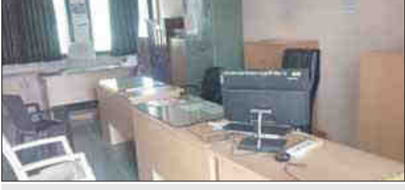
दौरे के नाम पर ऑफिस से गायब रहने का फंडा अपना रहे कर्मचारी

संवाददाता/प्रतिदिन अखबार चांदूर बाजार, 24 नवंबर - स्थानीय पंचायत समिति प्रशासन पर किसी वरिष्ठ अधिकारी का नियंत्रण न रहने से सर्वत्र मनमानी कामकाज चल रहा है. शुक्रवार की सुबह 10.20 बजे प्रतिनिधि ने कार्यालय में पहुंचकर देखा तो गुट विकास अधिकारी छोड़कर अन्य विभागों में अधिकांश अधिकारी व कर्मचारी उपस्थित नहीं थे. पंचायत समिति कार्यालय के विविध विभागों में 45 कर्मचारी कार्यरत हैं. इनमें से 15 अधिकारी-कर्मचारी अनुपस्थित पाए गए. तो अन्य अधिकारी दौरे के नाम पर कार्यालय से गायब रहने की जानकारी मिली. स्थानीय निर्माण विभाग में