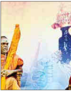
केंद्रीय मंत्री गडकरी ने कहा