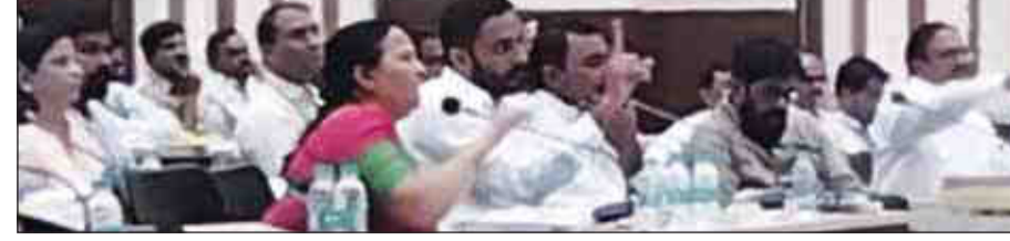
संवाददाता/प्रतिदिन अखबार मोर्शी, 24 नवंबर - जिले के

जिला नियोजन मंडल की बैठक में विधायक भुयार आक्रामक