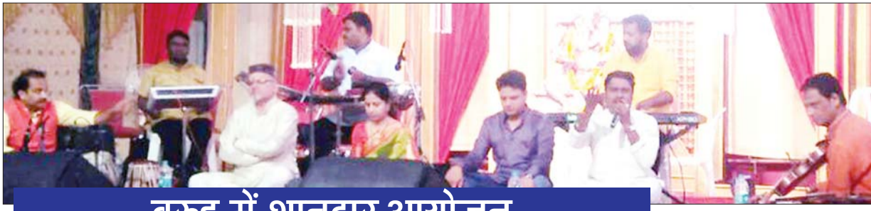
वरुड़ : यावलकर सभागृह में पहाट पाड़वा कार्यक्रम में बेहतरीन प्रस्तुति देते कलाकार तथा उपस्थित महिला-पुरुष.

संवाददाता, 21 मार्च वरुड़ - हर साल की तरह इस वर्ष भी देशबंधु वाचनालय, हेल्लपाइन, डॉ. शारद देशमुख चैरिटेबल ट्रस्ट, स्वागत बिछायत केंद्र