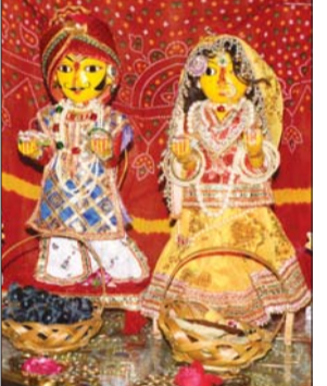
बैडबाजे के साथ निकाला बिंदोरा