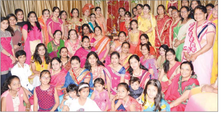
अमरावती : राजस्थानी महिला मंडल की महिलाएं गणगौर मनाती हुईं.