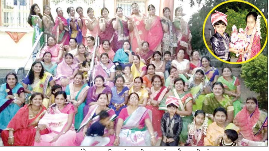
वरुड़ : खंडेलवाल महिला मंडल की सदस्यएं गणगौर मनाती हुईं.