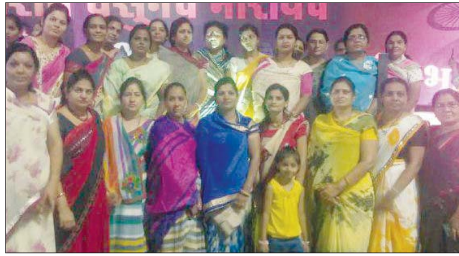
अमरावती : पुलवामा में हुए आतंकी हमले का निषेध करतीं माहेश्वरी महिला मंडल की सदस्याएं.