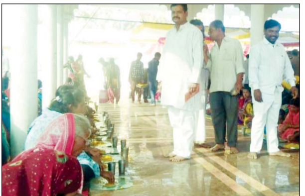
चांदूर रेलवे : महाप्रसाद का लाभ लेते श्रद्धालु.

इस महाप्रसाद कार्यक्रम की सफलता के लिए श्री संत बेंडोजी