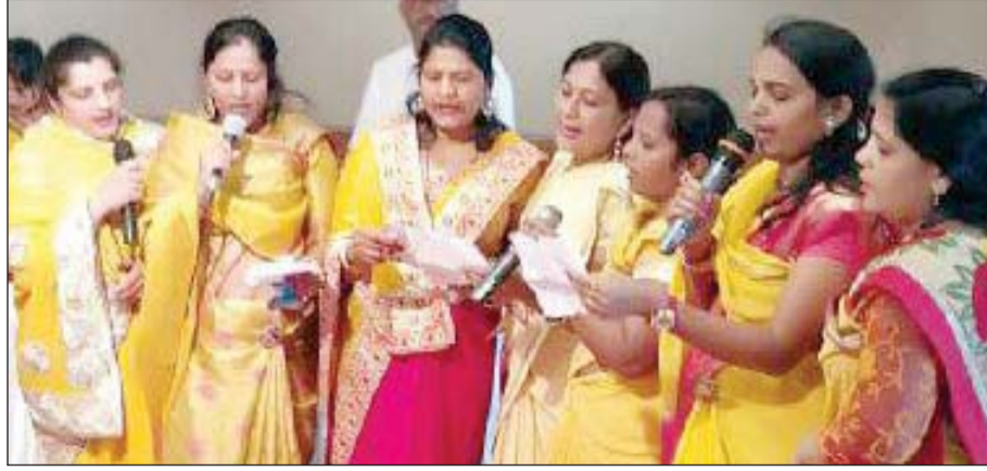
परतवाड़ा : वसंत पंचमी महोत्सव में सहभागी महिलाएं.