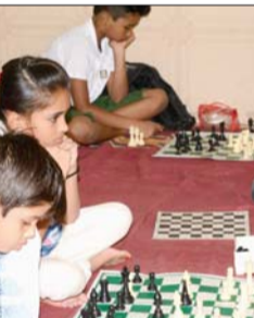
अमरावती : धनराज लेन स्थित माहेश्वरी भवन में बच्चों के लिए आयोजित विभिन्न प्रतियोगिता में अपने हूनर की कला दिखाते प्रतिभागी.